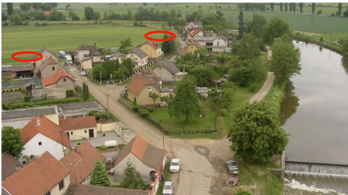
Lokalita Z4 (část) a Z5 doplňující koncovou uliční zástavbu

Plocha dotváří koncovou uliční zástavbu v jižní části Chodouně. Je určena pro výstavbu až čtyř rodinných domů uzavřenou pásem zahrad, na západě pro pás zeleně. Lokalitu zasahuje vymezené záplavové území Q 100 (záplava stanovena ještě před realizací protipovodňových opatření). Lokalita není zaplavována od toku řeky je oddělena protipovodňovou hrází chránící tuto pravobřežní část vesnice. - Nová zástavba nebo stavební úpravy v plochách Q 100 musí respektovat podmínky stanovené místně příslušným vodoprávním úřadem; nové objekty musí být situovány podélnou osou v souběhu s proudnicí možné záplavy - s úrovní \pm 0 objektu alespoň 0,3m nad vypočtenou hladinou Q 100 v daném místě; z objektu musí být zajištěn únik suchou cestou mimo vymezené území Q 100 .