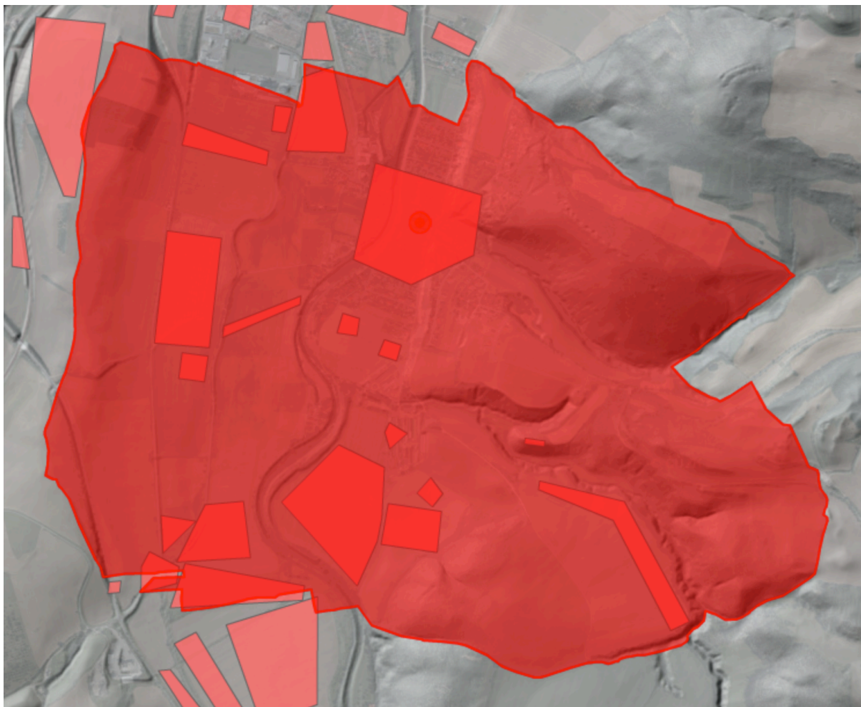
Přehled lokalit s pozitivně prokázaným výskytem archeologických nálezů

V případě archeologického nálezů je nezbytné dodržet ustanovení § 23 zákona č. 20/1987 Sb., o státní památkové péči, v platném znění, a to zejména oznamovací povinnost a povinnost zajištění archeologického nálezů a naleziště proti pozměnění situace, poškození nebo odcizení.