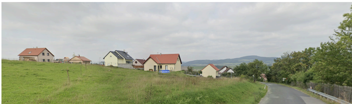
Pohled na novodobou zástavbu zasahující již do jiného krajinného prostoru - plošiny nad vesnicí

Problémem je rozvoj zástavby směrem do poloh nad 310 m n.m. Zde se domky dostávají mimo prostorové souvislosti soustředěného sídla (viz. obr.). Je tak vizuálně narušen krajinný rámec nad vesnicí.