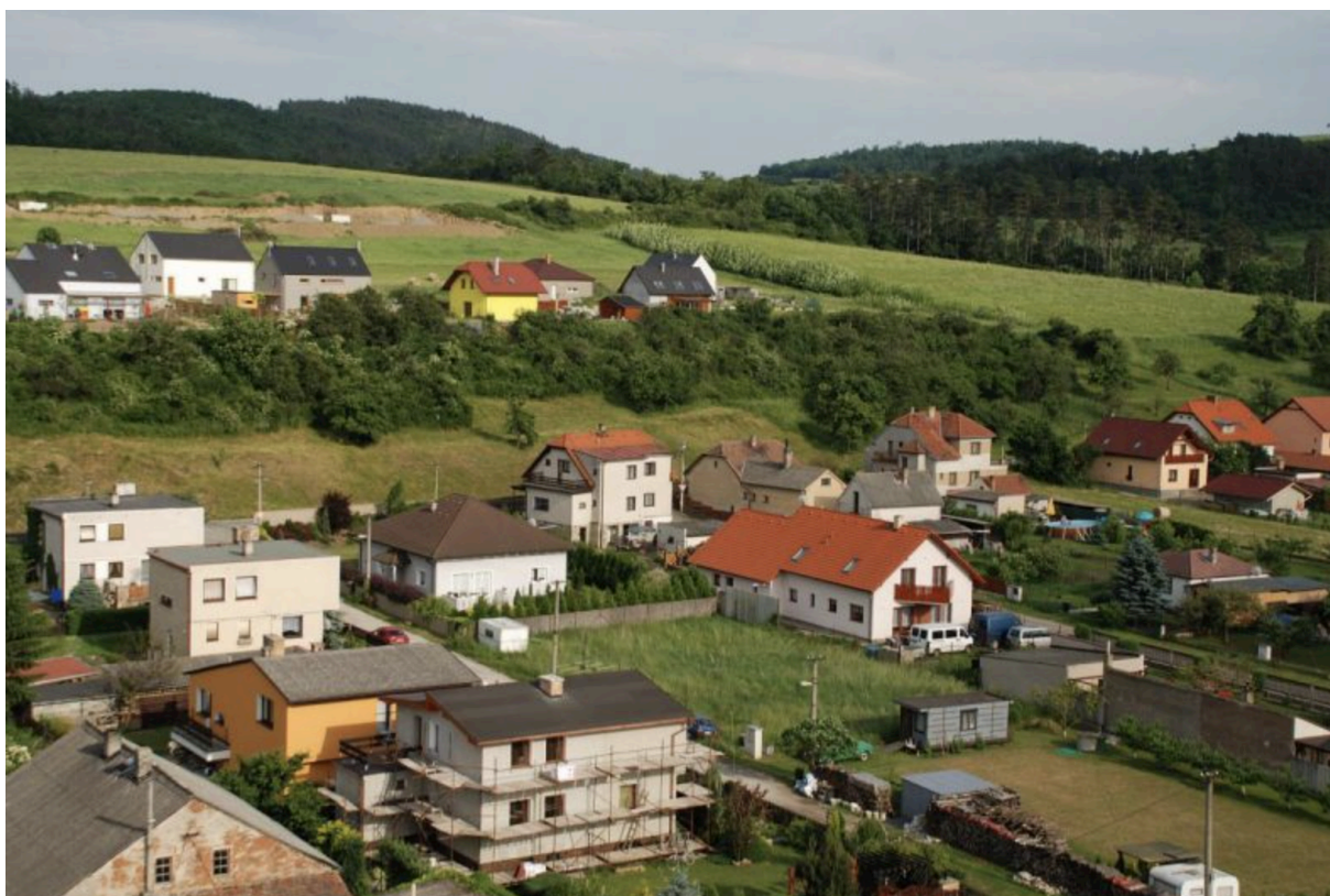
Pohled do novější části obce

V nivní krajině se dnes výrazně uplatňují zemědělské areály založené v období socialistického zemědělského hospodaření, ať jsou to podélné hmoty zemědělských staveb areálu umístěném v izolované poloze jižně od vesnice, nebo stavby s dominantní budovou sila na severním okraji katastru. Silo je ve srovnání s kostelíkem ve Zdicích doslova "chrámovou lodí" zemědělského funkčního využití.