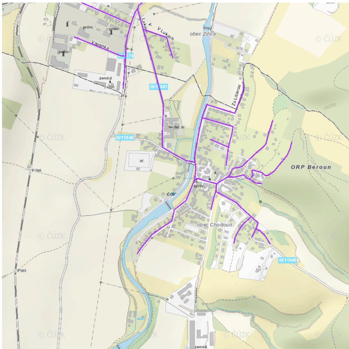
obr.: kanalizační síť v obci Chodouň (oddělná splašková kanalizace)