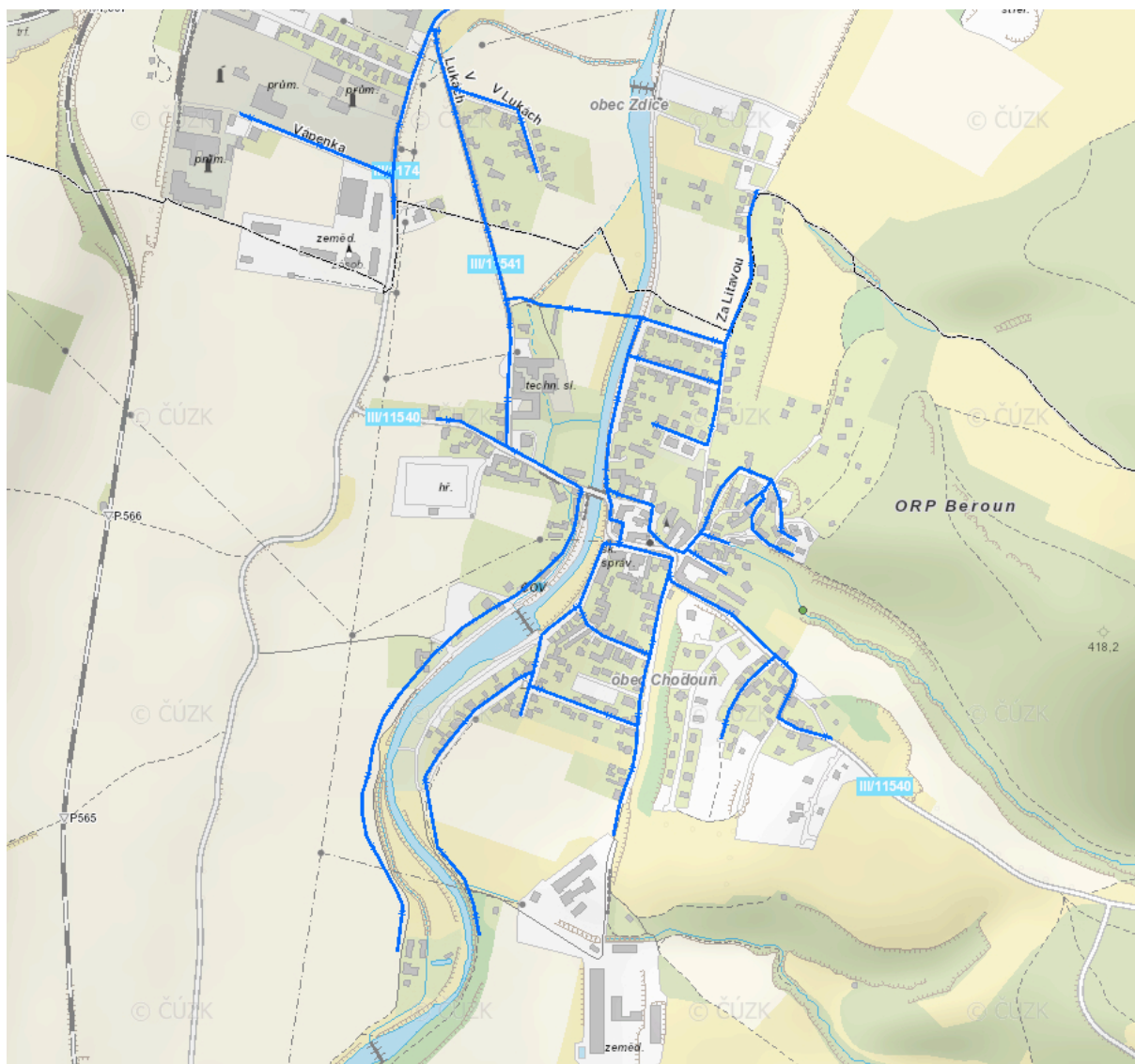
obr.: vodovodní síť v obci Chodouň

OP vodovodních řadů a kanalizačních stok činí (do DN 500 mm včetně) 1,5 m na každou stranu od vnějšího líce potrubí či stoky resp. 2,5 m při větší hloubce potrubí a dále 2,5 m na každou stranu od vnějšího líce potrubí či stoky (u DN nad DN 500 mm), resp. 3,5 m při větší hloubce potrubí. Ochranné pásmo přečerpávacích stanic je vymezováno dle konkrétních podmínek zadání.