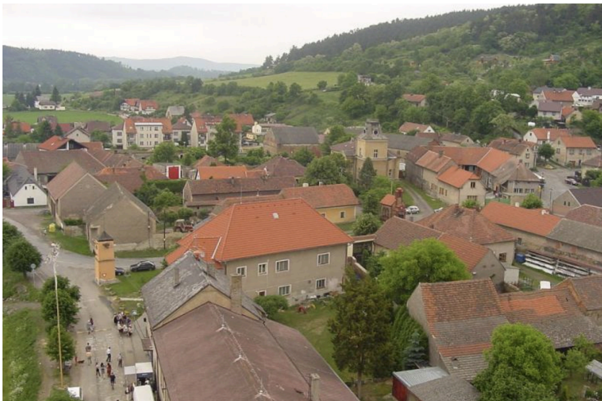
Pohled do pravobřežního historického jádra obce - stavby hmotově tradiční