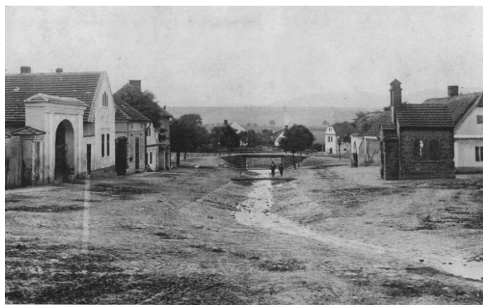
Náves s kapličkou (se svodnicí zaústěnou do Litavky)

Stavby jsou hmotově tradiční - jejich hmoty jsou protáhlé, zastřešení sedlovou střechou tradičního sklonu. Některé hmotově tradiční stavby patří k památkově hodnotným objektům. Ze staveb lidové architektury se dochovala zejména usedlost s číslem popisným 12 u návsi. Bez zajímavosti rozhodně není městská vila č.p. 18 s věží umístěná v areálu bývalého velkostatku, která se díky poloze v těžišti historického jádra a své velikosti uplatňuje co by subdominanta.